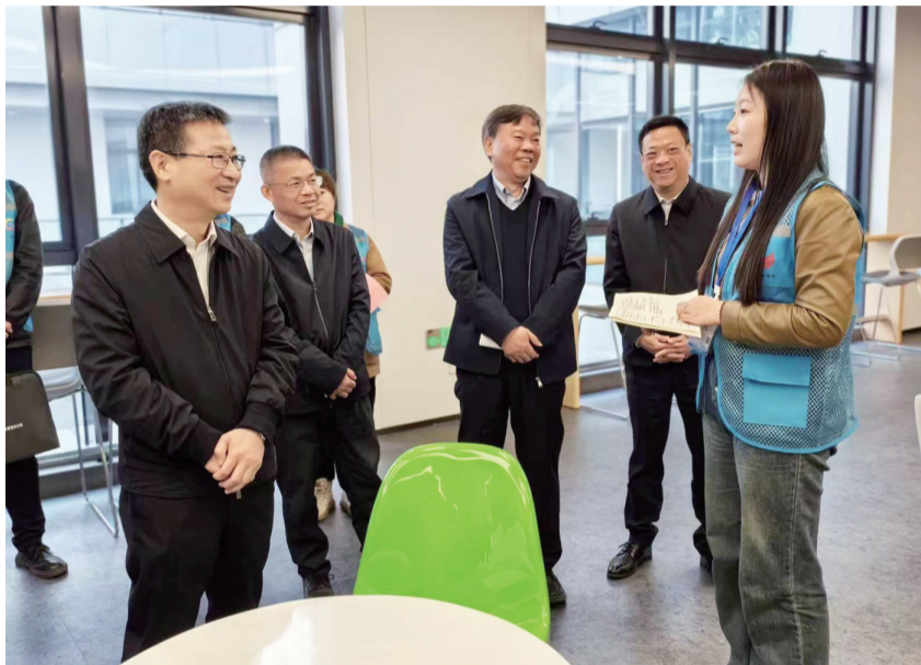
委副书记、省长王清宪,省委常委、秘书长张韵声,省委常委、常务副省长费高云等会见康义一行。安徽省政府有关负责同志,安徽统计局、国家统计局安徽调查总队和国家统计局办公室、普查中心负责同志陪同调研。

康义听取了安徽省统计局关于第五次全国经济普查工作的汇报。他指出,普查登记进入关键的攻坚决战期,各级普查机构要进一步振奋精神、担当作为,加快推进解决普查工作中的重点难点问题,高质量完成普查登记任务。康义强调,要把数据质量要求落实到普查登记、审核验收等各个环节,采取有效措施查全查实普查数据,既不能虚报,也不能瞒报漏报,坚决防治普查造假,确保普查结果经得起历史和实践检验。 康义来到国家统计局安徽调查总队,实地考察总队办公环境,详细了解统计调查工作开展情况,仔细翻阅党建工作基础台账资料。康义向总队全体干部职工表示慰问,勉励大家以实际行动更好推动统计调查事业发展。他强调,要坚持党建引领,认真做好各项民生调查,深入推进统计重点领域改革,促进现代信息技术与统计调查工作深度融合,切实把统计调查数据搞准搞实。 在皖期间,安徽省委书记韩俊,省