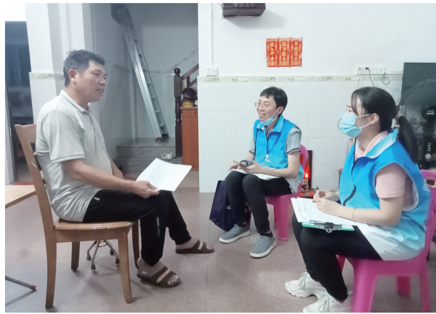
阳江队工作人员入户开展农民工监测调查。

加强制度建设,抓实队伍管理环节。一是严格执行调查制度,明确辅助调查员工作要求、管理细则,让调查工作规范化和精细化。二是紧抓台账建设,建立“一户一台账”制度,对台账进行动态管理,做好样本管理维护,夯实基层基础。三是完善辅助调查员考核评价制度,优化考核办法方案,明确数据真实性、上报及时性和基础工作规范性等考核标准,推行季度评优评比和奖励机制,鼓励辅助调查员创先争优,打造新