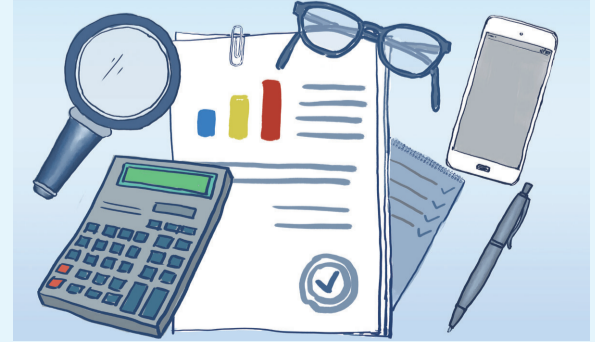
(作者单位:唐山市自然资源和规划局)