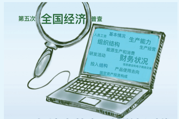
经济大普查 数说新时代