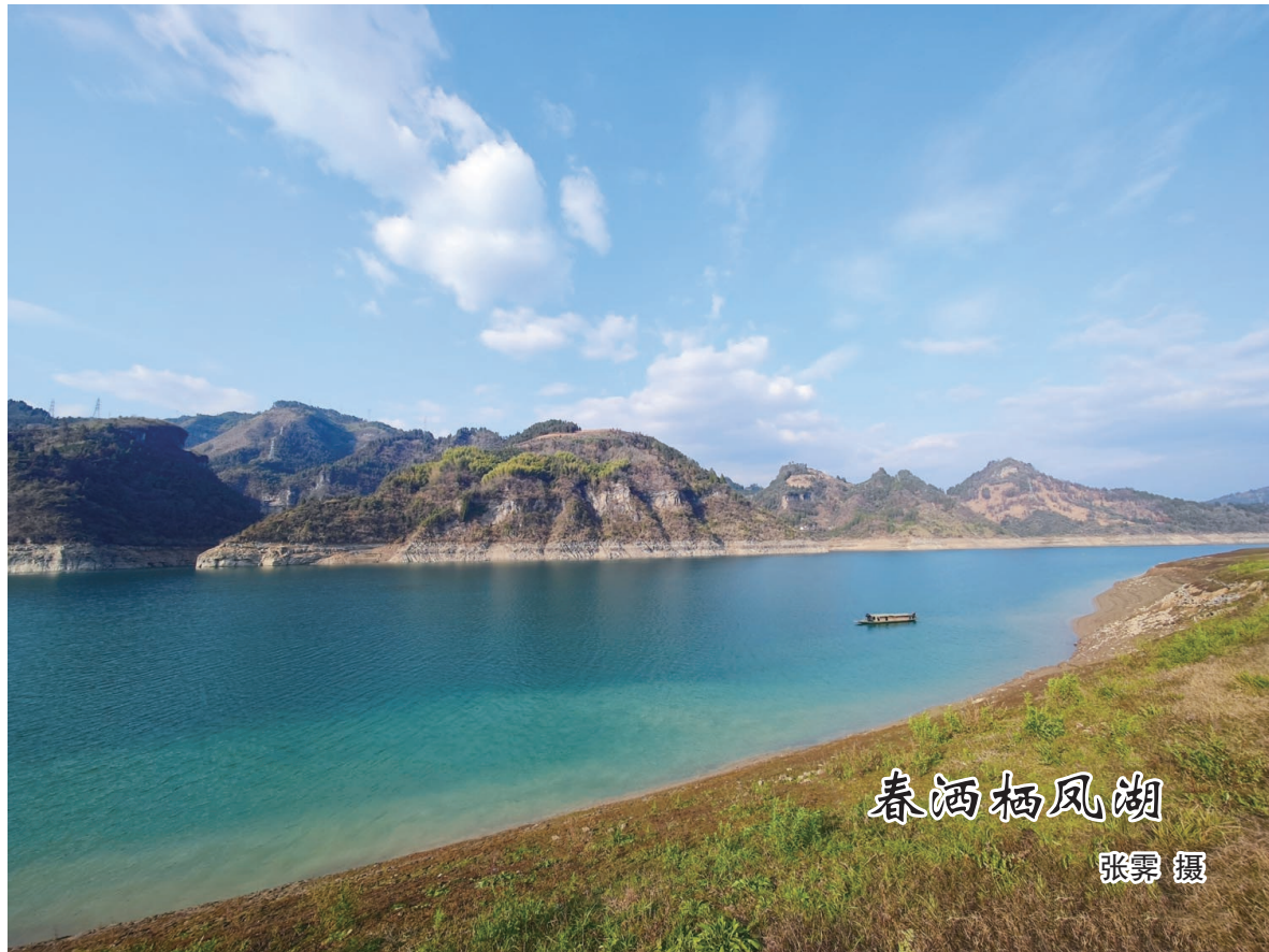
春洒栖凤湖

“作为一名调查人，每次得到调查对象的配合和信任，就特别满足，心里暖暖的”，小袁说。