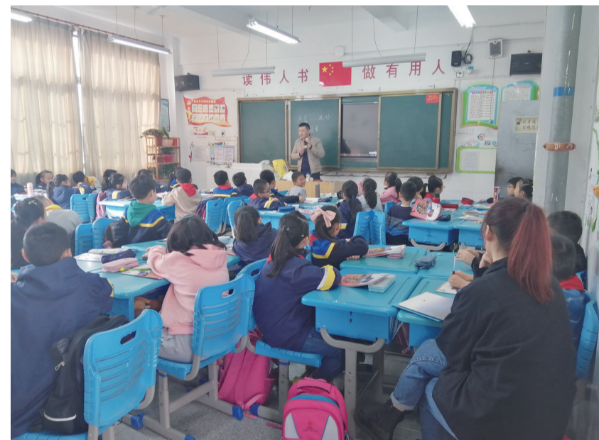
图为肥西县肥光小学青年教师正在为孩子们上科学课。

调研同时发现,肥西县乡村学校现有教师数量不足,教师队伍老化问题严重,教育教学工作压力较大。为此建议,肥西县拓宽乡村教师补充渠道,加大乡村教师招聘力度,优化教师队伍结构,完善职称评审机制,提升教师幸福指数。